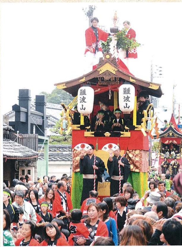
平成23年度 亀岡市観光写真コンテスト 亀岡祭山鉾連合会会長賞 受賞作品