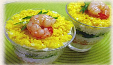
※実際の商品とは多少異なります

※ご飲食・お買い上げの方に、 保津川あられ本舗のひなあられつかみ取り券プレゼント (両日共先着50名)