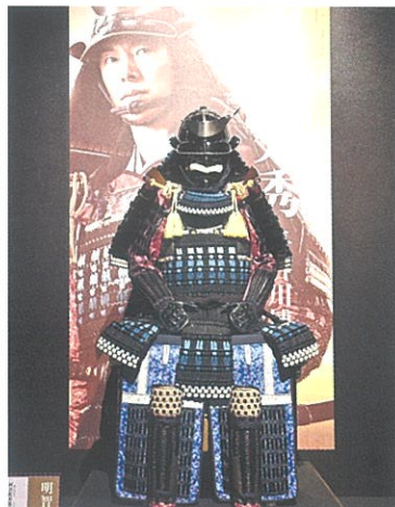
明智光秀の甲冑(撮影同等品)10月から展示