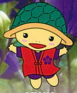
亀岡市観光 マスコットキャラクター 「明智かめまる」