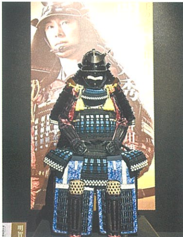
明智光秀の甲冑(撮影同等品)10月から展示