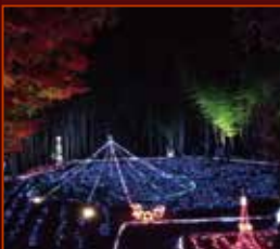
京都丹波 夢ナリエ