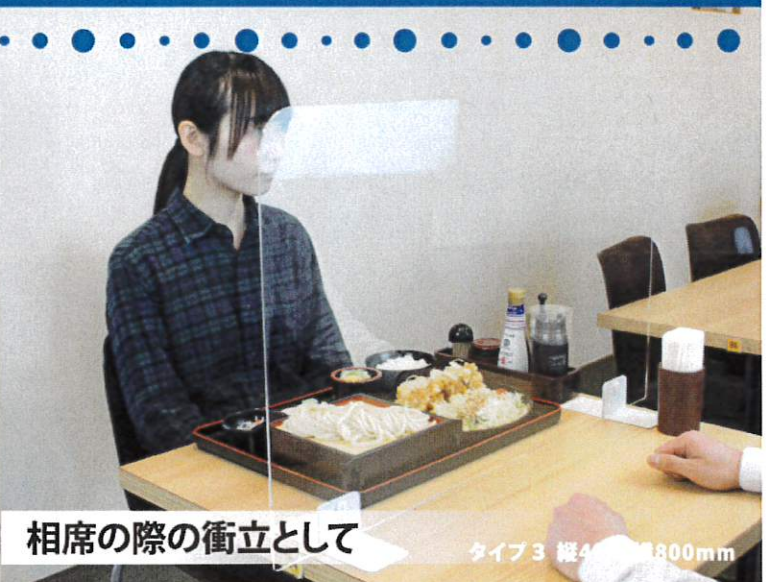
相席の際の衝立として